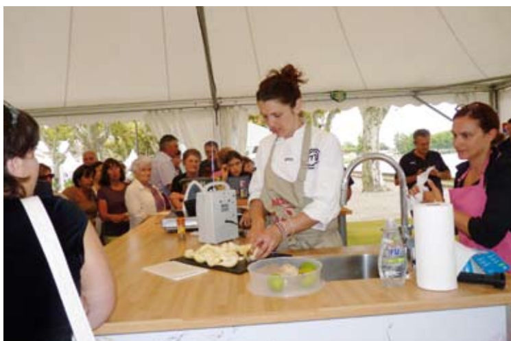
Animations des ateliers culinaires.