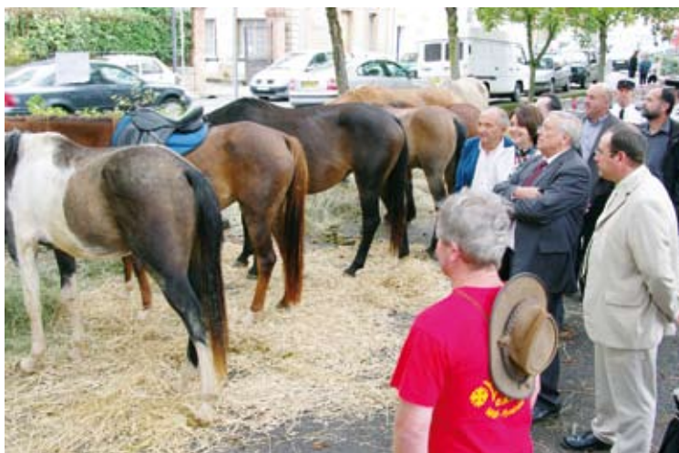
Inauguration du comice agricole.