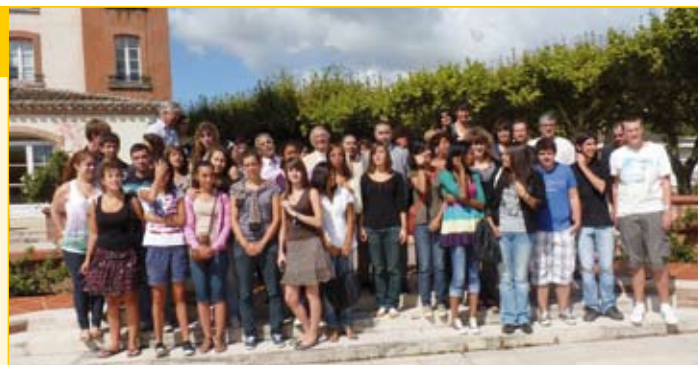
Réception des bacheliers de juin 2011 félicités par l'équipe municipale lors de la cérémonie organisée au Moulin de Moissac, le samedi 27 août dernier. A cette occasion, chacun a reçu une place pour un concert de leur choix valable pendant la durée de la saison culturelle.

découlent du travail des élèves et de la qualité de l'encadrement personnalisé proposé par l'équipe pédagogique, qui assure un bon suivi des élèves en raison de la petite taille du lycée. Brevet des collèges : 85,7% de réussite dont 48 mentions Brevet technologique : 80% de réussite dont 5 mentions Certificat de formation générale : 92,3 % de réussite