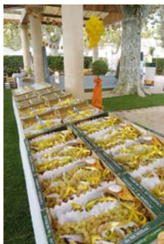
Célébration des 40 ans de l'AOC Chasselas de Moissac.