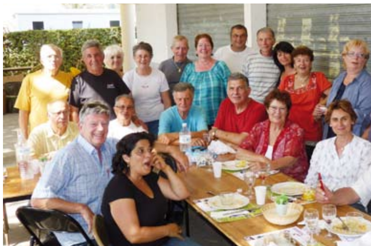
Repas des bénévoles à la veille de la Fête des Fruits.