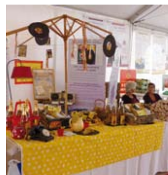
Quelques stands de la filière fruitière.