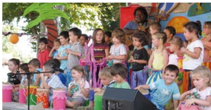
Grande fête de fin de séjour organisée aussi bien en juillet qu'en août par les enfants et les animateurs.

A travers les énigmes du jeu de pistes, les jeunes ont découvert ou redécouvert des lieux historiques et culturels grâce au personnel du cloître, du Carmel et du musée « Marguerite Vidal ». L'après-midi, ils ont embarqué sur des bateaux pour une ballade sur le Tarn. La participation des équipes pédagogiques ainsi que celle de Guy, du service municipal des sports, a permis de réaliser cette animation en toute sécurité. L'après-midi s'est clôturé par un goûter géant. La journée s'est déroulée avec le concours de la direction du service