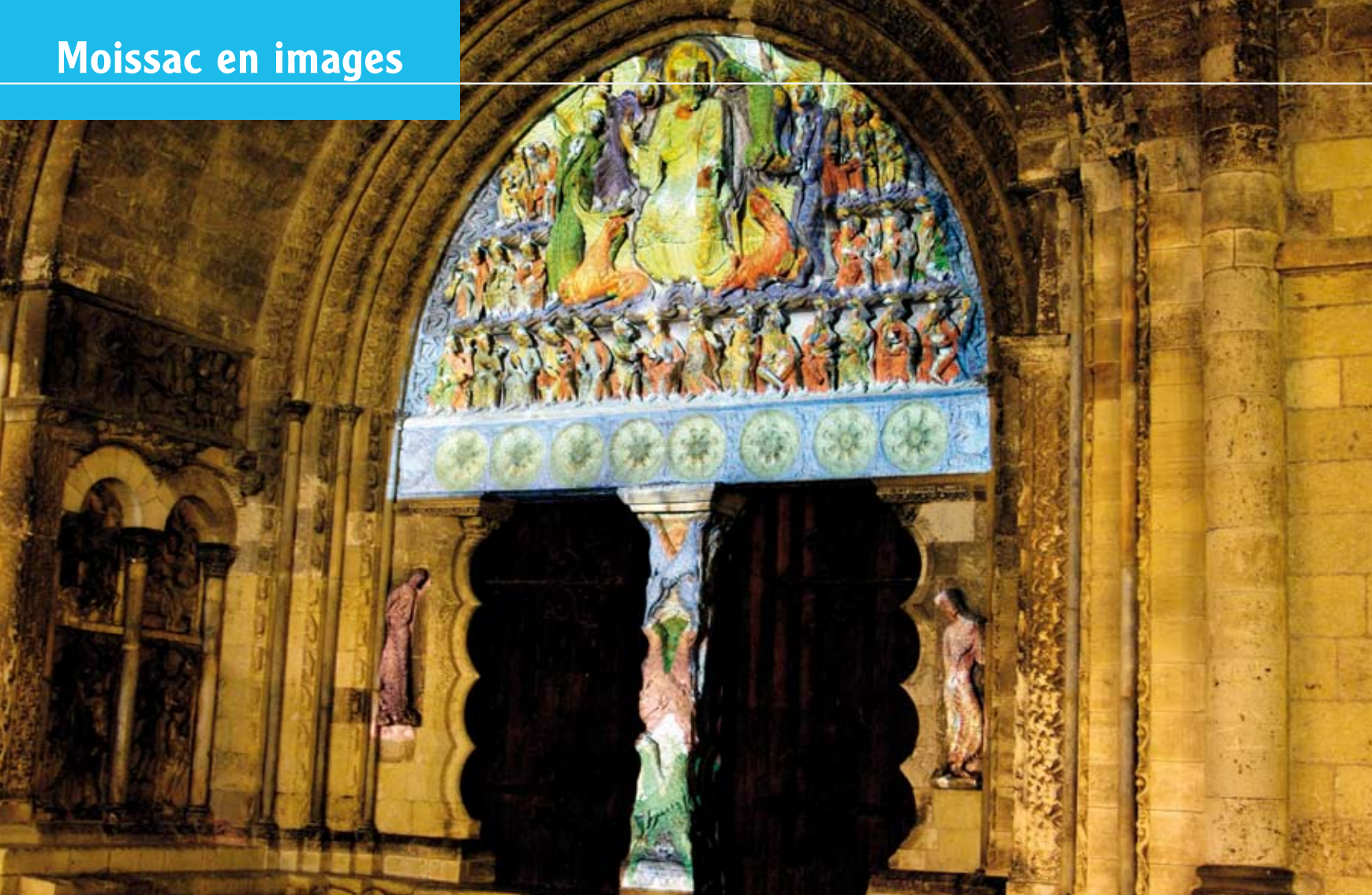
Illuminations du parvis de l'abbatiale du 14 juillet au 25 août.