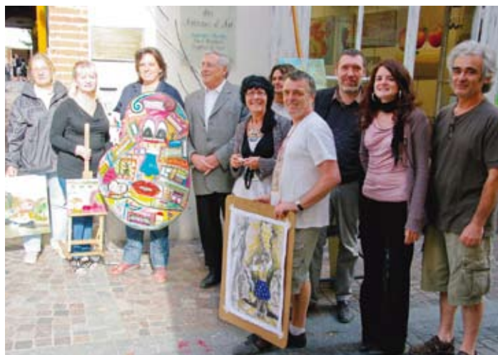
Rue des Arts : remise des prix du concours de peinture organisé dans le cadre de la Fête des Fruits.