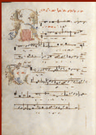
Requiem ; Occo Codex XV e s. ms IV922 f133v