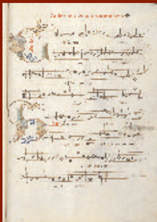
Requiem ; Occo Codex XV e s. ms IV922 f134r