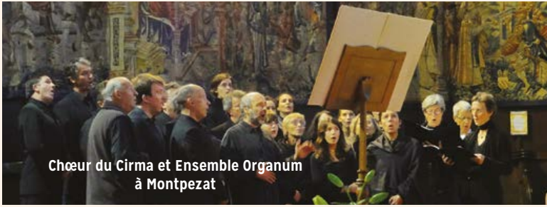
Chœur du Cirma et Ensemble Organum à Montpezat

Du samedi 27 OCTOBRE au vendredi 2 NOVEMBRE