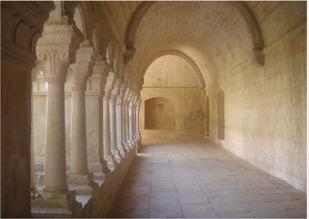
Sénanque, le cloître

Depuis Juillet 2002, Moissac est devenu un lieu singulier qui offre, à ceux qui aiment la musique et souhaitent en découvrir l'essence, la possibilité de se plonger à la source même de l'acte musical, grâce à la Grande Journée de l'Improvisation dans les Musiques Anciennes qui commence à l'aube et se termine au cœur de la nuit.