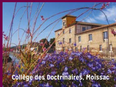
Collège des Doctrinaires, Moissac

L'Association Organum en résidence à Moissac depuis 2001, soutient et développe la recherche dans le domaine des musiques anciennes actuelles et traditionnelles de l'Europe et du Bassin méditerranéen. La diffusion de ces répertoires est assurée par l'Ensemble Organum. Les activités de recherche, d'enseignement, de diffusion et de publication de l'Association sont regroupées sous l'appellation CIRMA (Centre Itinérant de Recherche sur les Musiques Anciennes). Le chœur du CIRMA est constitué par les étudiants - venus des quatre coins de la planète - qui ont suivi les différentes sessions de formation.