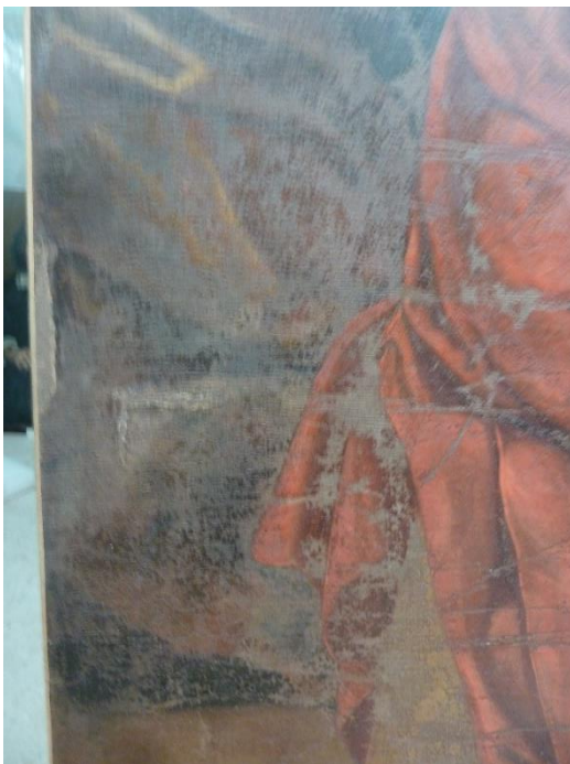
Figure 4 : Zon inférieure dextre particulièrement abimée.

Les zones lacunaires sont toujours visibles. Elles sont particulièrement importantes en partie basse, et le long du bord dextre. Elles rendent compte du fait que la toile a été longtemps conservée pliée dans un milieu humide, couche picturale vers l'intérieur. En conséquence, la couche picturale présente de nombreuses zones de micro écaillage (lacunes de peintures très complexes provoquées par la perte de multiples petites écailles).