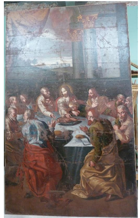
Figure 1 : Le tableau dans son état actuel.