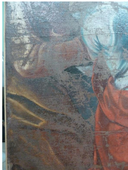
Figure 3 : Zone inférieure dextre particulièrement abimée.