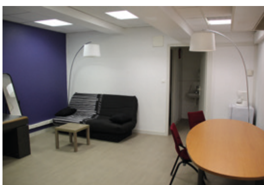
Une autre loge.