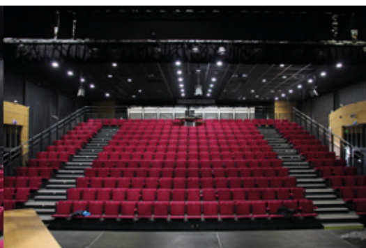
Vue sur les gradins depuis la scène.