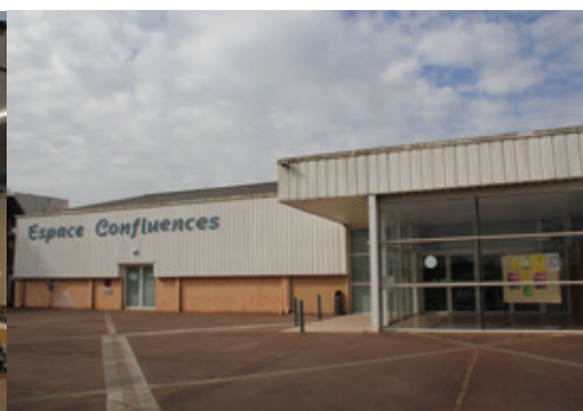
Façade de la salle avec le hall d'entrée.