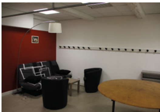
Une des 4 loges.