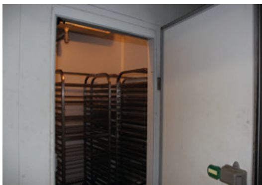
La chambre froide.