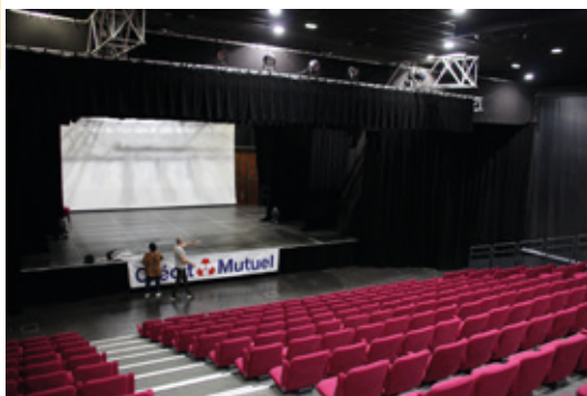
Vue de la scène depuis le haut des gradins.