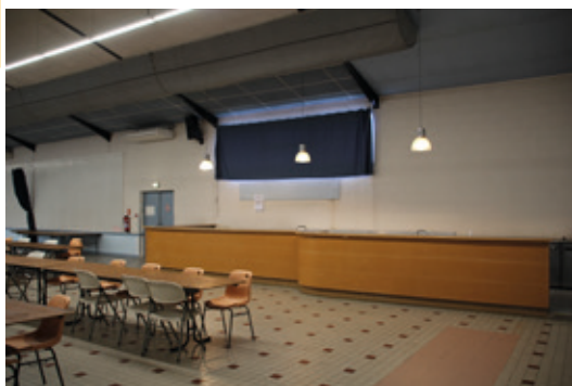
Vue du bar depuis la salle.