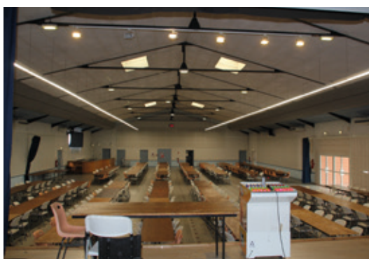
La salle en configuration loto depuis la scène.