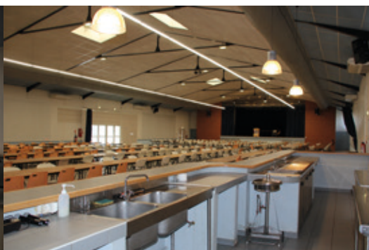
Vue du bar