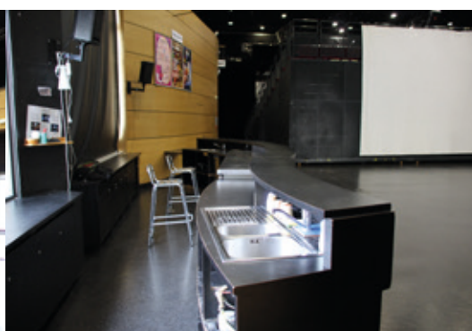
Le bar équipé.