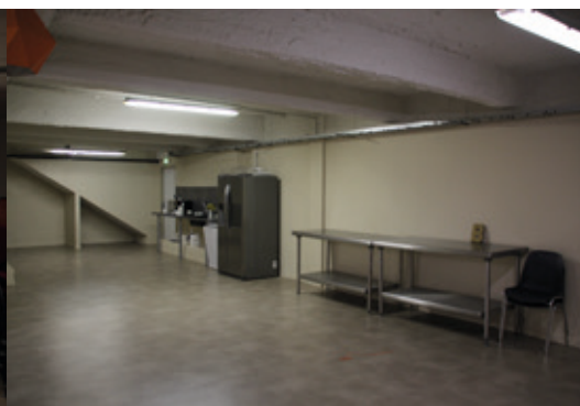
La salle de restauration.