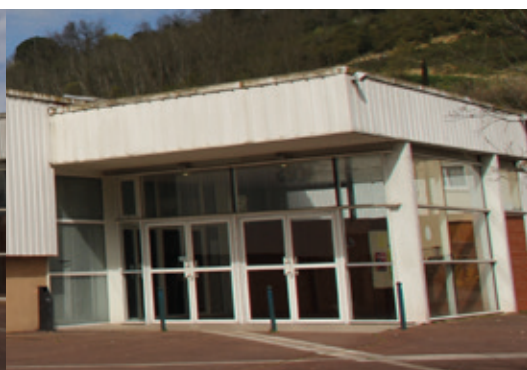
Le hall d'entrée.