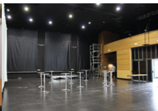
L'espace derrière les gradins modulables.